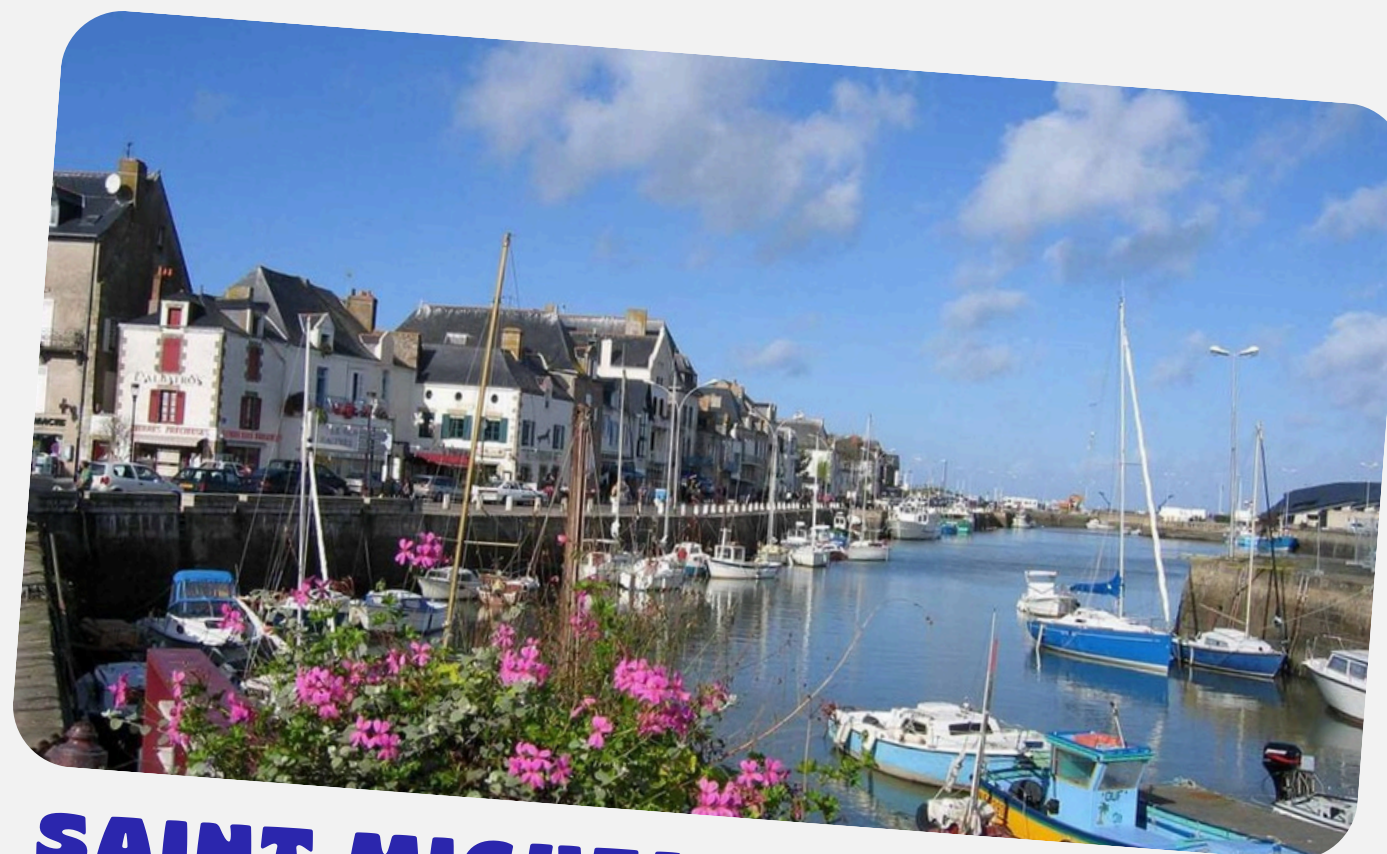
SAINT MICHEL CHEF-CHEF