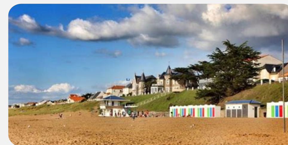
PLAGE DE THARON (<1KM)