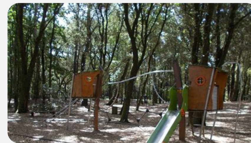
BOIS ROY (5MIN)